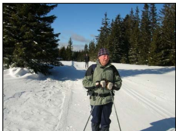
Na polceste do Corony a dva dni od Mariazellu.