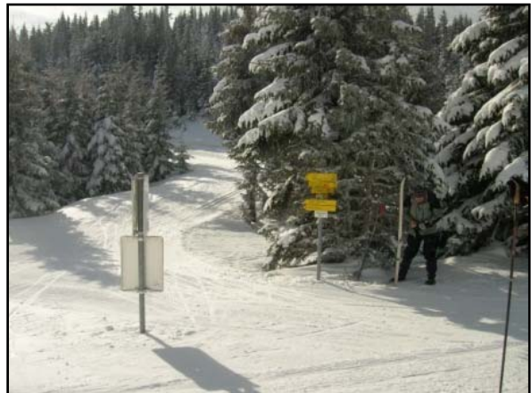
Najvyšší bod trasy Trochkrajovroh 1560m nad morom.