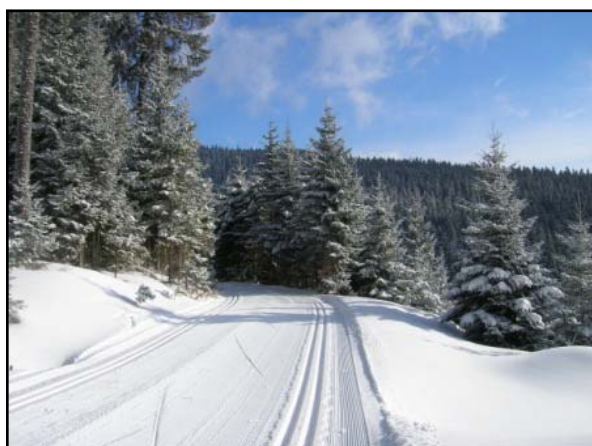
Prvé stúpanie z parkoviska.

Dohadujeme sa na trase. Dreiländereck – Corona – späť cez Steyersberger Schwaig. Tvrdý podklad je pocukrovaný prašanom. Tam kde fúka vietor je odkrytý terén zmrznutý na kosť. Zjazdy a stúpania v týchto miestach vôbec nie sú sladké.