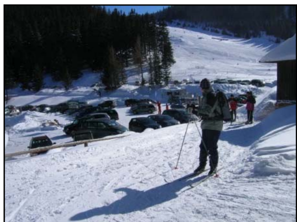
A už sme tam. Najvyššie položené nástupné miesto. 1357m nad morom.