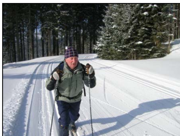
Aj Milan stúpa.