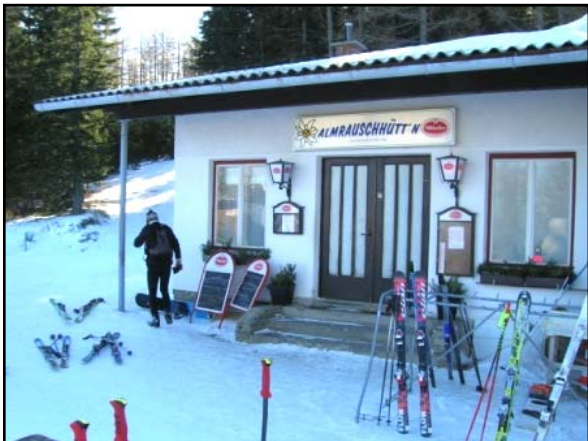
Dnešný cieľ - Svätá Koruna (prosíme nekonvertovať).